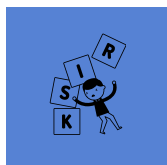
Estimation des risques